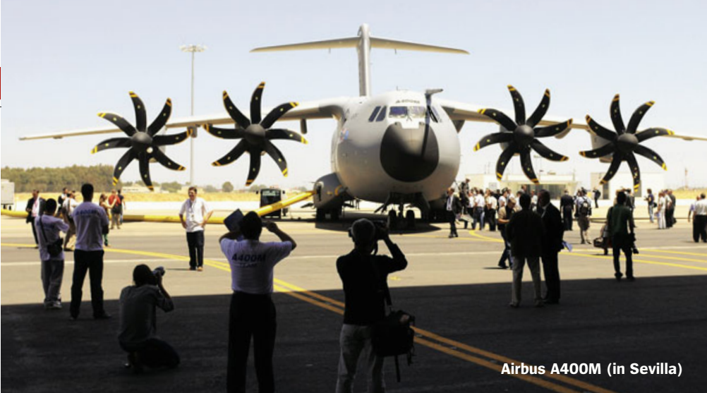
Airbus A400M (in Sevilla)