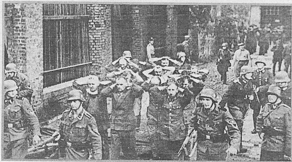
Obrońcy Poczty Polskiej w Gdańsku wyprowadzani po kapitulacji.